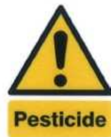
Plantes malades, et plantes traitées