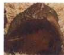
Bois de cagettes et gros branchages