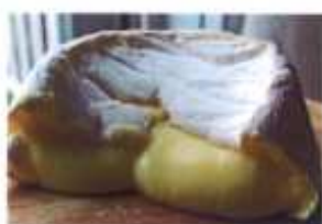
Croutes de fromage