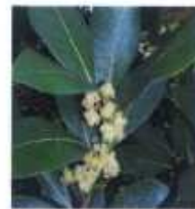
Résineux (thuyas, cyprès ...), Feuilles vernisées ( lierre, laurier...) Plantes rampantes