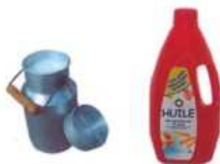
Laitages et matières grasses